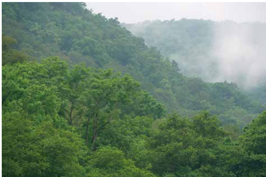
Abb. 1: Im Klimawandel bedroht: Buchenwälder im Kammerforst. Trotz Eignung wurde die südliche Hälfte bisher noch nicht geschützt.

Die Dürresommer 2018 und 2019 haben deutlich vor Augen geführt, was der Klimawandel für unsere Wälder bedeuten kann. In Hessen gab es dramatische Baumschäden auf etwa 23.000 Hektar Waldfläche. Überwiegend betroffen war die Fichte, die sich in Hessen als standortfremde Baumart nicht mehr unter den neuen Klimabedingungen behaupten kann. Aber auch viele heimische Laubbäume litten unter der Trockenheit. Selbst bei einer moderaten Klimaerwärmung droht in Deutschland der Verlust von über 15 % der Tier- und Pflanzenarten (HLNUG 2019).