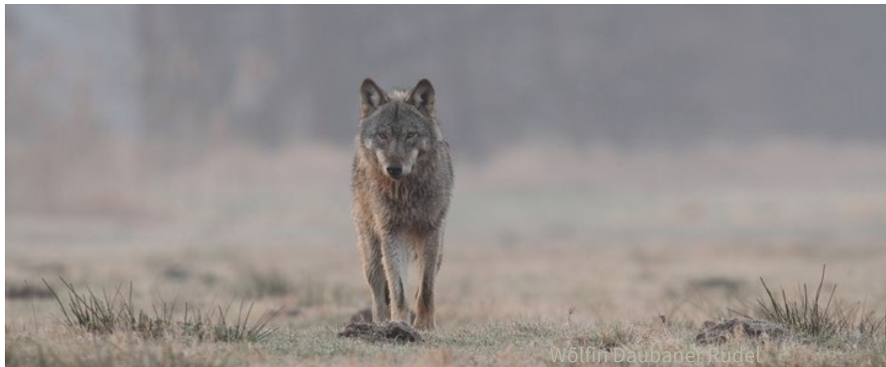
Wölfin Daubaner Rudel

https://weact.campact.de/petitions/herdenschutz-statt-wolfsjagd-stoppt-die-novelle-des-bundesjagdgesetzes