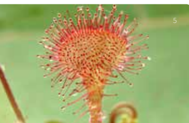
5 Rundblättriger Sonnentau