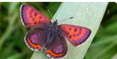
3 Blauschillernder Feuerfalter